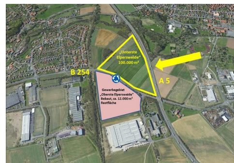
Foto des Baugebiets