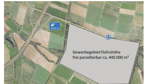
Foto oder Maßstab des Bauplatzes

Das Gebiet liegt direkt an der Autobahn A 5 und der Anschlussstelle Alsfeld Ost. Die Grundstücke sind frei parzellierbar.