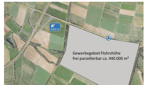
Foto des Baugebiets