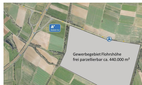
Foto oder Maßstäbe des Bauplatzes

Das Gebiet liegt direkt an der Autobahn A 5 und der Anschlussstelle Alsfeld Ost. Die Grundstücke sind frei parzellierbar.