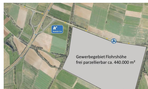
Foto oder Maßstab des Bauplatzes

Das Gebiet liegt direkt an der Autobahn A 5 und der Anschlussstelle Alsfeld Ost. Die Grundstücke sind frei parzellierbar.