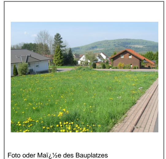
Foto oder Maßstab des Bauplatzes