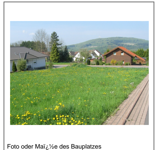
Foto oder Maßstab des Bauplatzes