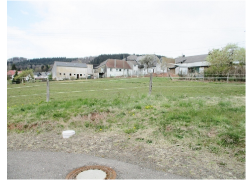
Foto oder Maã¼ã¼e des Bauplatzes