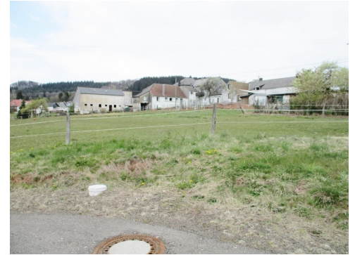
Foto oder Maßã¼e des Bauplatzes