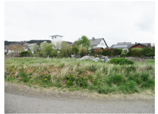
Foto oder Maã¼ã¼e des Bauplatzes