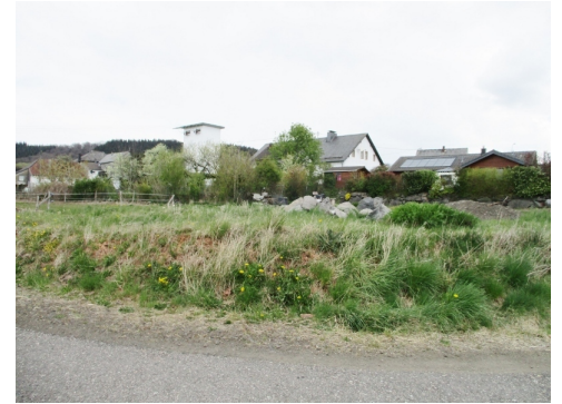
Foto oder Maã¼ã¼e des Bauplatzes