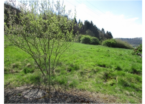
Foto oder Maiç½e des Bauplatzes