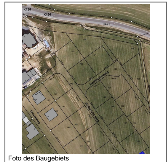
Foto des Baugebiets