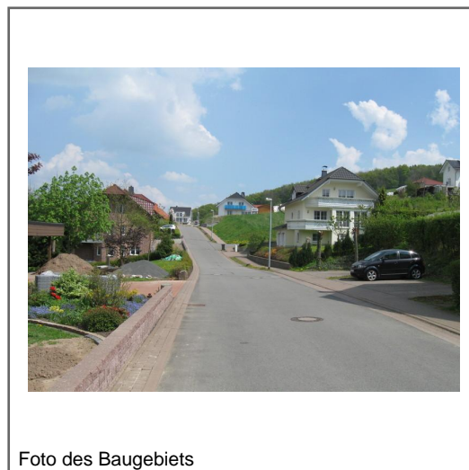
Foto des Baugebiets