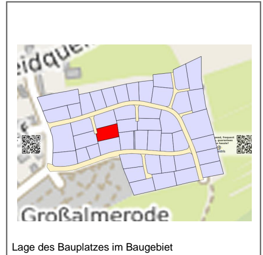
Lage des Bauplatzes im Baugebiet