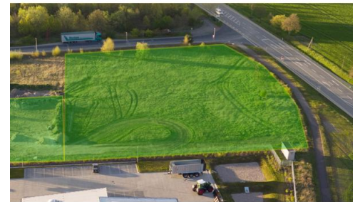
Foto oder Maß 1 / 2 e des Bauplatzes