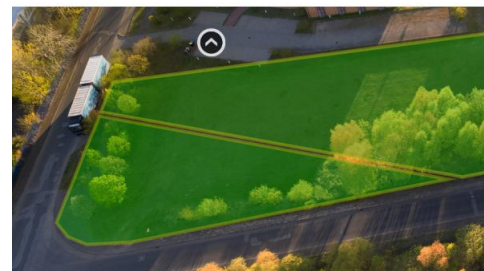
Foto oder Maß½e des Bauplatzes