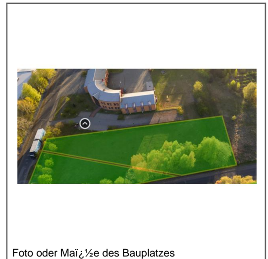
Foto oder Maß½e des Bauplatzes