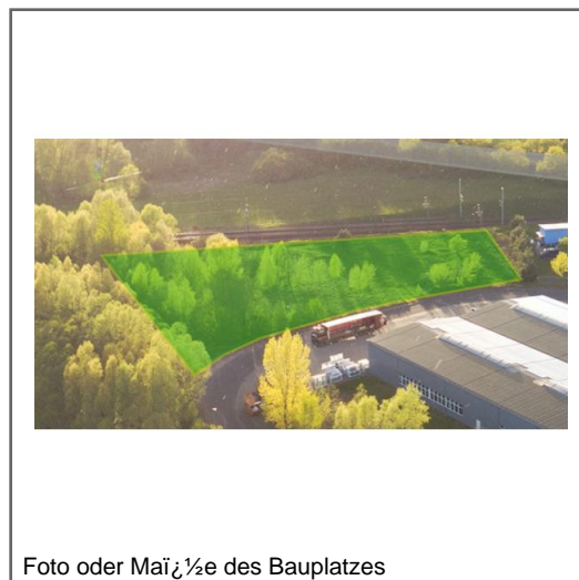
Foto oder Maß½e des Bauplatzes