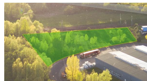
Foto oder Maß½e des Bauplatzes