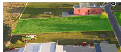
Foto oder Maß½e des Bauplatzes