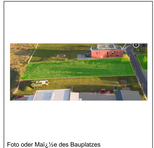
Foto oder Maß½e des Bauplatzes