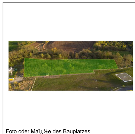
Foto oder Maß½e des Bauplatzes