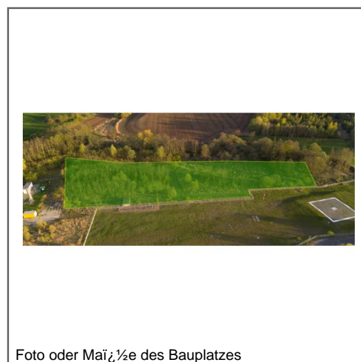
Foto oder Maß½e des Bauplatzes