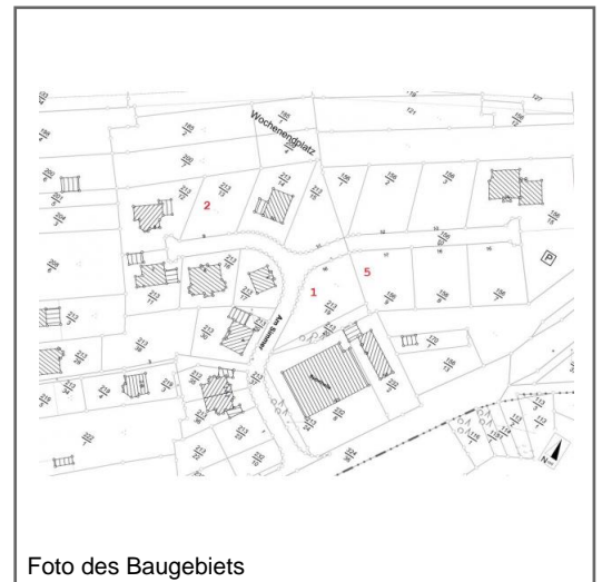
Foto des Baugebiets