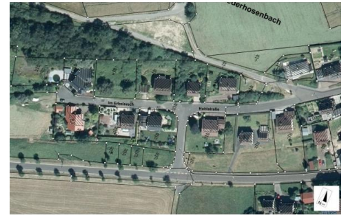
Foto des Baugebiets