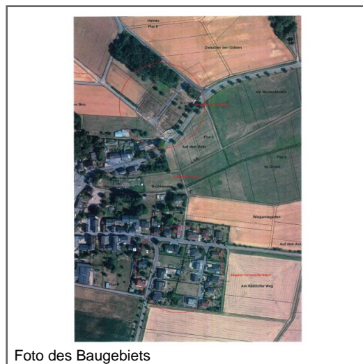
Foto des Baugebiets

Die Ortsgemeinde Hainau hat in ihrem Baugebiet "Am Erlengraben" noch Grundst \frac{1}{4} cke zu verkaufen.