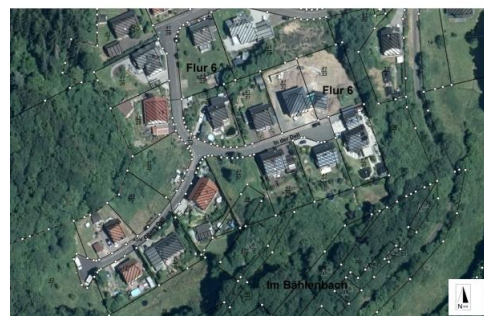
Foto des Baugebiets