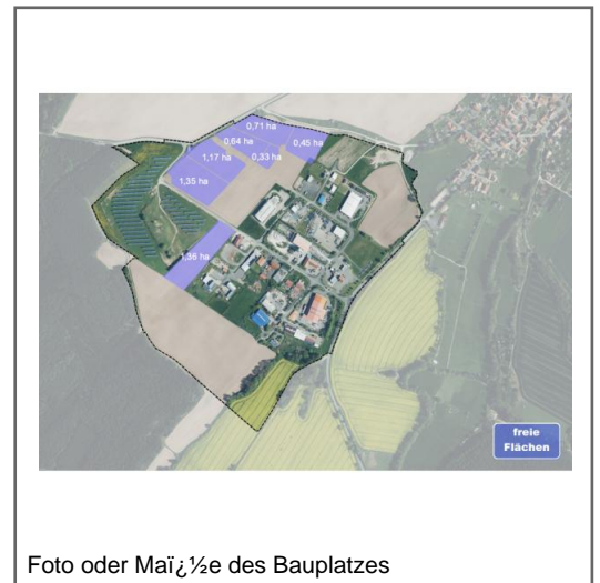
Foto oder Maßstab des Bauplatzes

Gesamtgröße des Gewerbegebiets: 47,5 ha Freie Flächen: 6,01 ha Planungsstand: B-Plan Erschließungsstand: teilerschlossen Grundstückspreis: nach Vereinbarung Verkehrsanbindung: A4 - 25 km nach Eisenach / Bahn 3 km Bad Salzungen Firmen/Branchen am Standort: Metallbau, Mosterei, Sportservice, Dienstleistung, Baugewerbe, Tankstelle, Lackfabrik, Bauplanungsbüro, Hoch- und Tiefbau