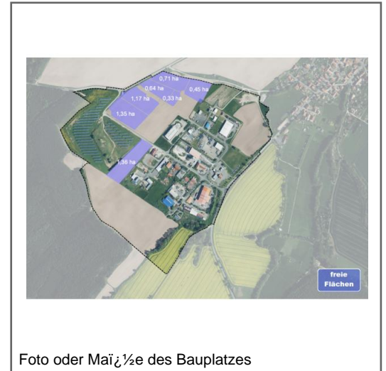
Foto oder Maßstab des Bauplatzes

Gesamtgröße des Gewerbegebiets: 47,5 ha Freie Flächen: 6,01 ha Planungsstand: B-Plan Erschließungsstand: teilerschlossen Grundstückspreis: nach Vereinbarung Verkehrsanbindung: A4 - 25 km nach Eisenach / Bahn 3 km Bad Salzungen Firmen/Branchen am Standort: Metallbau, Mosterei, Sportservice, Dienstleistung, Baugewerbe, Tankstelle, Lackfabrik, Bauplanungsbüro, Hoch- und Tiefbau