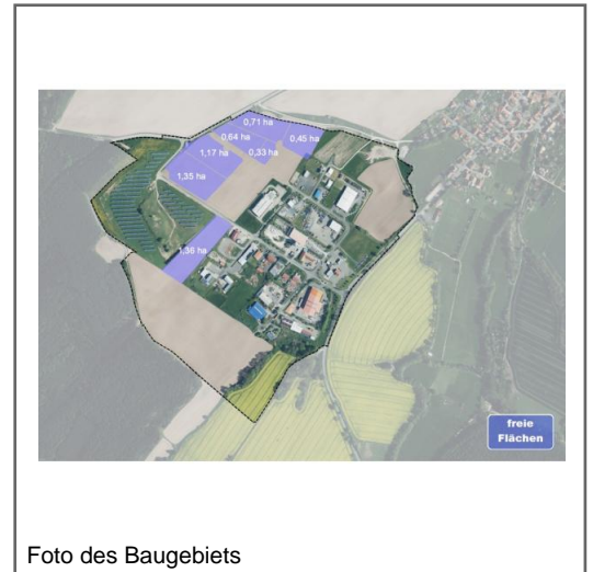
Foto des Baugebiets