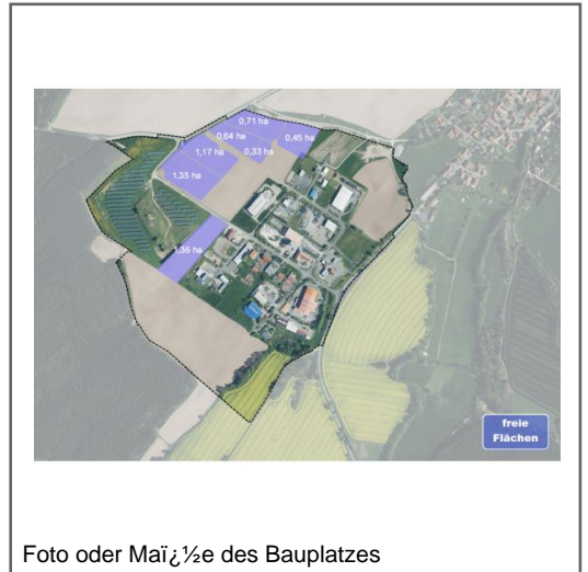
Foto oder Maßstab des Bauplatzes