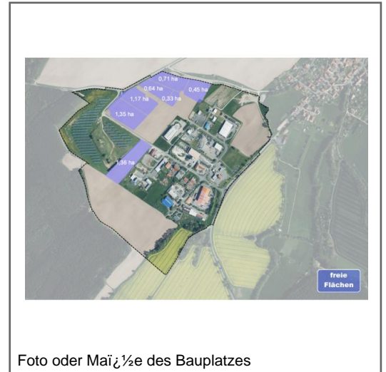
Foto oder Maßstab des Bauplatzes