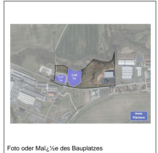
Foto oder Maß 1 / 2 e des Bauplatzes

Gesamtgr 1 / 4 e des Gewerbegebiets: 6,38 ha brutto Freie Fl 1 / 4 chen: 1,33 ha Planungsstand: B-Plan (einsehbar auf der Internetseite der Gemeinde Barchfeld-Immelborn) Erschlie 1 / 4 ungsstand: voll erschlossen m 1 / 4 gl. Baubeginn: sofort Grundst 1 / 4 ckspreis: nach Vereinbarung Verkehrsanbindung: A4 â€“ 7 km Eisenach West / Bahn 14 km Eisenach Firmen/Branchen am Standort: M 1 / 4 beltischlerei, Holzverarbeitung, Kunststoffverarbeitung, Elektrotechnik