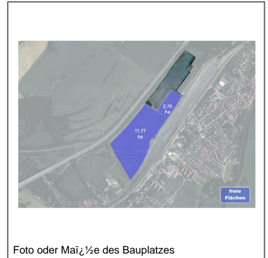
Foto oder Maß 1 / 2 e des Bauplatzes