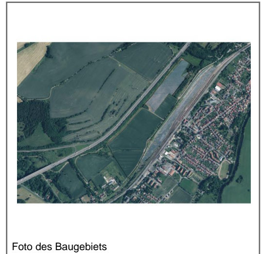
Foto des Baugebiets