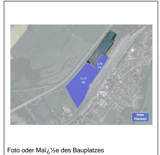
Foto oder Ma 1 / 2 e des Bauplatzes