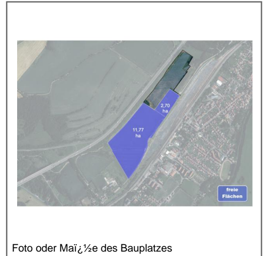
Foto oder Ma 1 / 2 e des Bauplatzes