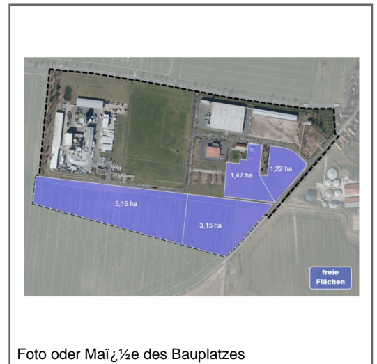
Foto oder MaÃŸe des Bauplatzes

Firmen/Branchen am Standort: Umweltservice, Verkehrshof, Baumaterialien