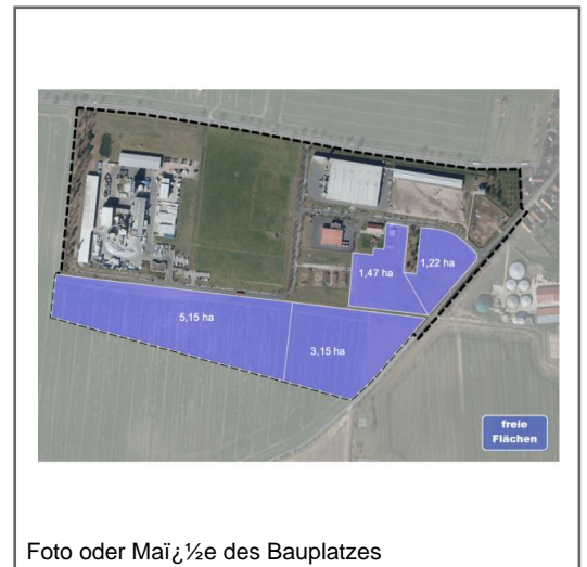
Foto oder Maßç½e des Bauplatzes

Firmen/Branchen am Standort: Umweltservice, Verkehrshof, Baumaterialien