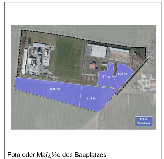
Foto oder Maß½e des Bauplatzes

Firmen/Branchen am Standort: Umweltservice, Verkehrshof, Baumaterialien