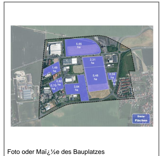
Foto oder Maßstab des Bauplatzes

Firmen/Branchen am Standort: Kunststoffverarbeitung, Logistik, Fahrzeugbau, Holzverarbeitung, Umweltservice, Deutsche Post, Getränkehandel