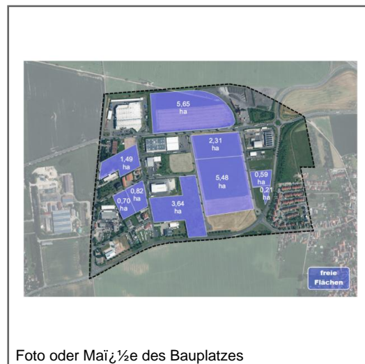
Foto oder Maß½e des Bauplatzes

Firmen/Branchen am Standort: Kunststoffverarbeitung, Logistik, Fahrzeugbau, Holzverarbeitung, Umweltservice, Deutsche Post, GetrÄnkehandel