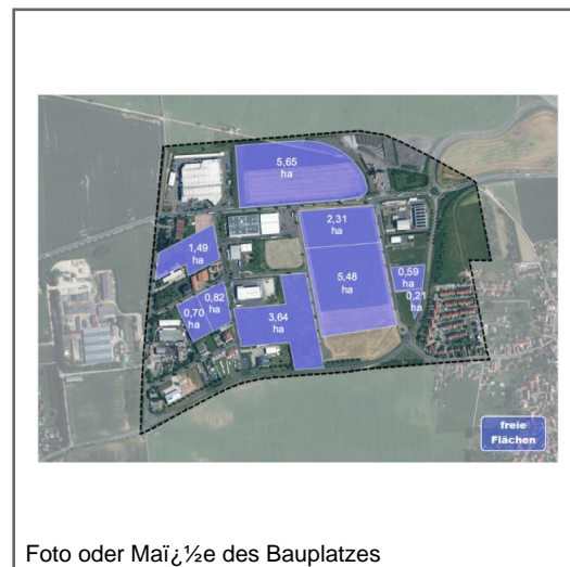
Foto oder Maß½e des Bauplatzes

Firmen/Branchen am Standort: Kunststoffverarbeitung, Logistik, Fahrzeugbau, Holzverarbeitung, Umweltservice, Deutsche Post, GetrÄnkehandel