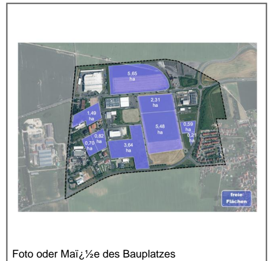
Foto oder Maß½e des Bauplatzes

Firmen/Branchen am Standort: Kunststoffverarbeitung, Logistik, Fahrzeugbau, Holzverarbeitung, Umweltservice, Deutsche Post, GetrÄnkehandel