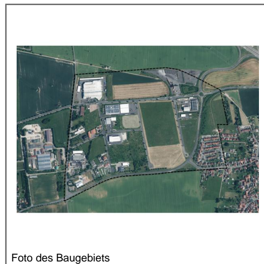
Foto des Baugebiets