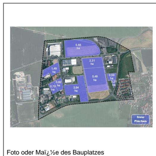
Foto oder Maßstab des Bauplatzes

Firmen/Branchen am Standort: Kunststoffverarbeitung, Logistik, Fahrzeugbau, Holzverarbeitung, Umweltservice, Deutsche Post, Getränkehandel