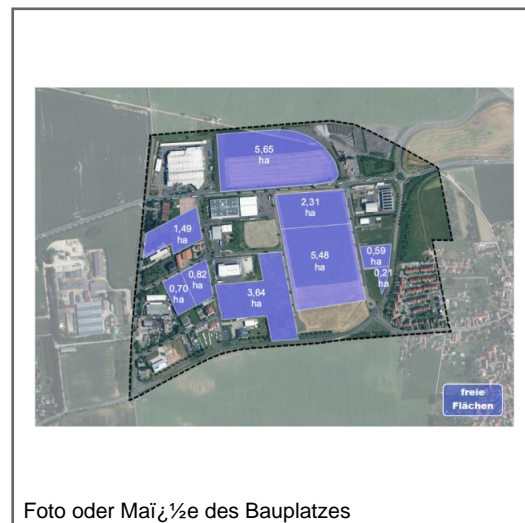
Foto oder Maßstab des Bauplatzes

Firmen/Branchen am Standort: Kunststoffverarbeitung, Logistik, Fahrzeugbau, Holzverarbeitung, Umweltservice, Deutsche Post, Getränkehandel