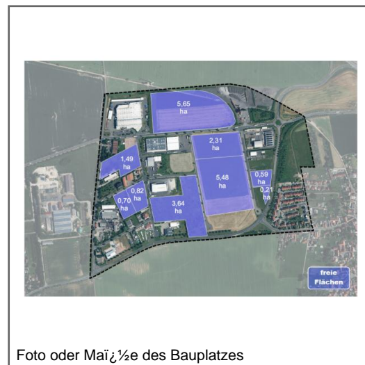
Foto oder Maßstab des Bauplatzes

Firmen/Branchen am Standort: Kunststoffverarbeitung, Logistik, Fahrzeugbau, Holzverarbeitung, Umweltservice, Deutsche Post, Getränkehandel