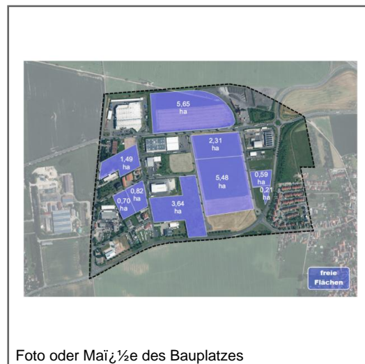
Foto oder Maßstab des Bauplatzes

Firmen/Branchen am Standort: Kunststoffverarbeitung, Logistik, Fahrzeugbau, Holzverarbeitung, Umweltservice, Deutsche Post, Getränkehandel