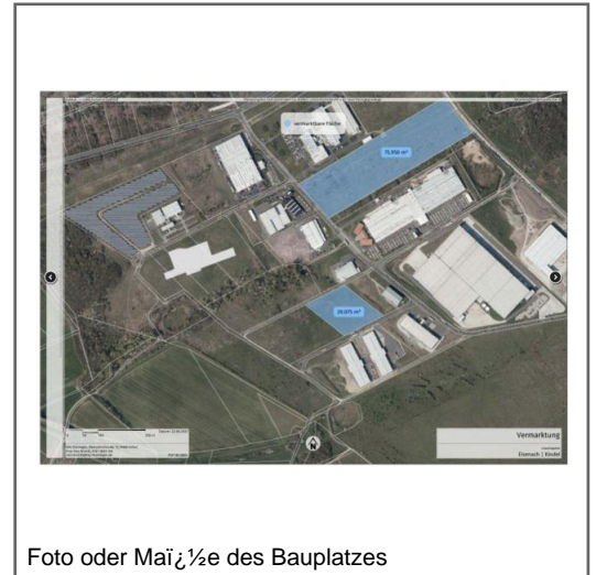
Foto oder Maß½e des Bauplatzes