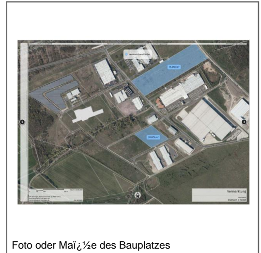
Foto oder Maß½e des Bauplatzes