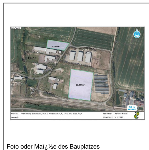
Foto oder Maßç½e des Bauplatzes