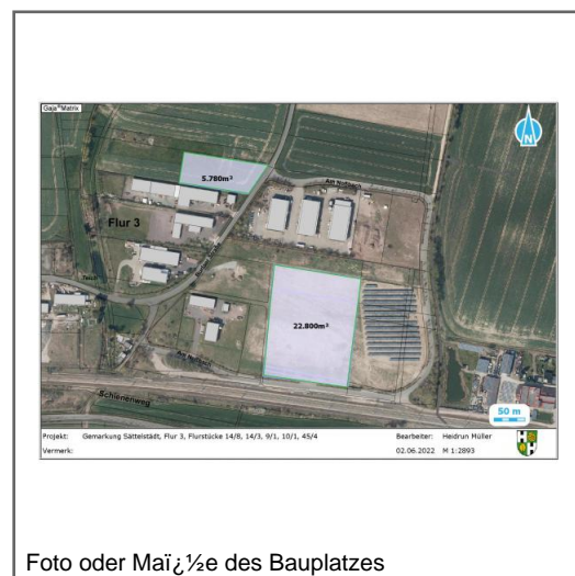
Foto oder Maß½e des Bauplatzes