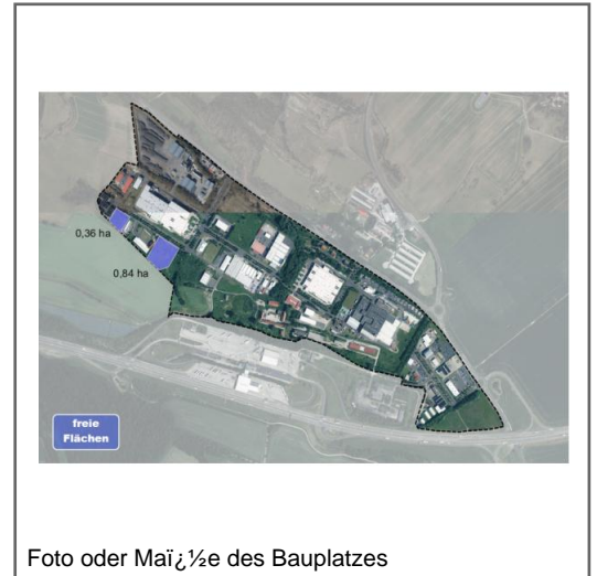
Foto oder Maß 1 / 2 e des Bauplatzes

Gesamtgr 1 / 2 e des Gewerbegebiets: 60 ha brutto Freie Fl 1 / 2 chen: 4,74 ha netto Planungsstand: B-Plan Erschlie 1 / 2 ungsstand: erschlossen m 1 / 2 gl. Baubeginn: sofort Grundst 1 / 2 ckspreis: nach Vereinbarung Verkehrsanbindung: A4 â€“ 0,5 km Eisenach West / Bahn â€“ 5,0 km Eisenach Firmen/Branchen am Standort: BMW, Spedition, Recycling, Lebensmittelproduktion, Baubetriebe, Kfz-Branche, elektr. Bauelemente, Metallverarbeitung, Kunststoffverarbeitung, Sicherheitsdienst