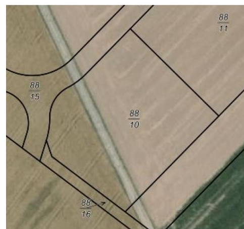
Foto oder Maß 1 / 2 e des Bauplatzes