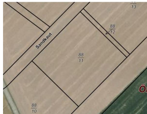
Foto oder Maß 1 / 2 e des Bauplatzes