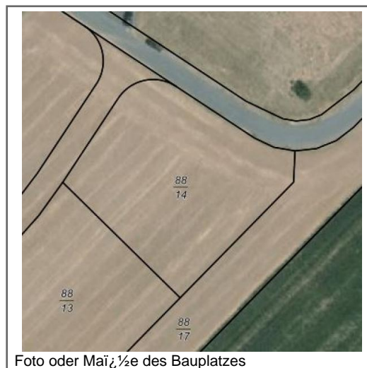
Foto oder Maß 1 / 2 e des Bauplatzes