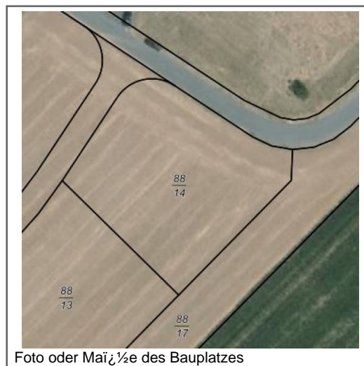
Foto oder Maß 1 / 2 e des Bauplatzes