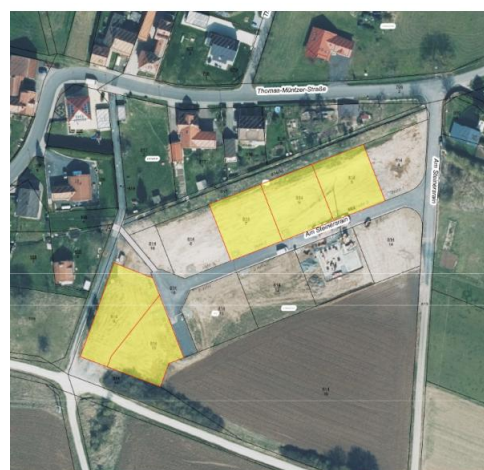
Foto des Baugebiets