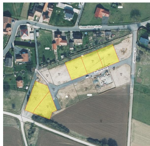
Foto oder MaÄ½e des Bauplatzes

Der Ortsteil SÄ¼nna hat ca. 1 000 Einwohner und verfÄ½gt Ä½ber eine Grundschule, eine KindertagesstÄ½tte, ein