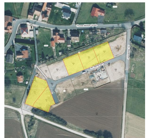
Foto oder MaÄ¼e des Bauplatzes