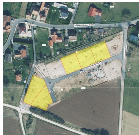
Foto oder MaÄ¼e des Bauplatzes

Der Ortsteil SÄ¼nna hat ca. 1 000 Einwohner und verfÄ¼gt Ä¼ber eine Grundschule, eine KindertagesstÄ¼tte, ein