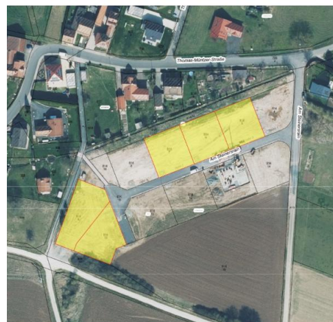
Foto oder MaÄ¼e des Bauplatzes

Der Ortsteil SÄ¼nna hat ca. 1 000 Einwohner und verfÄ¼gt Ä¼ber eine Grundschule, eine KindertagesstÄ¼tte, ein