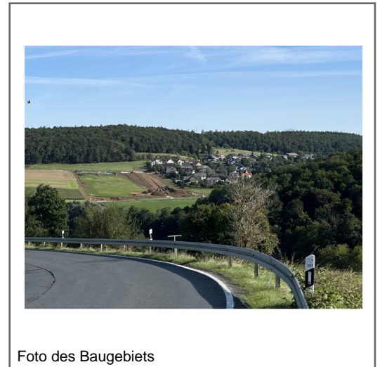
Foto des Baugebiets