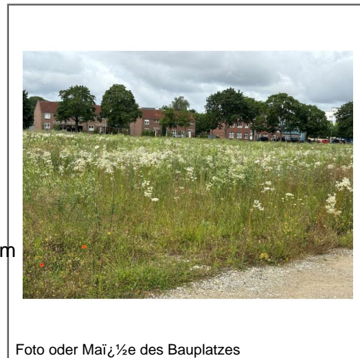
Foto oder MÃ¼Ã¼e des Bauplatzes