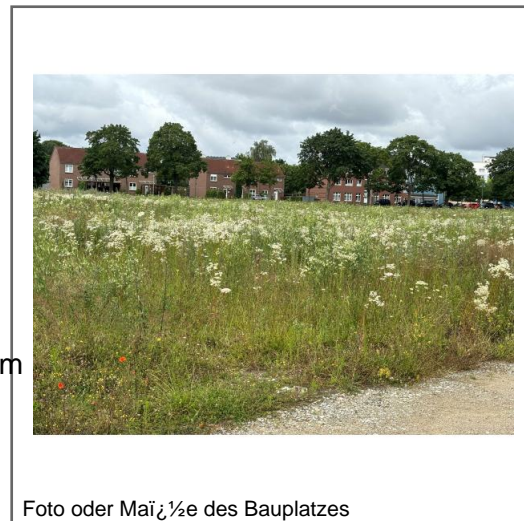
Foto oder Maã¼e des Bauplatzes