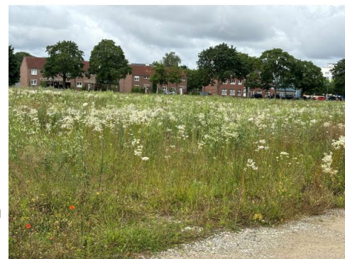
Foto oder MÃ¼Ã¼e des Bauplatzes